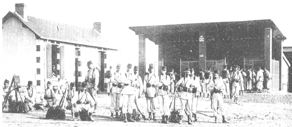
Stand de tir d'Ancenis, en 1904. Le 64 ème Rgt Infanterie au tir